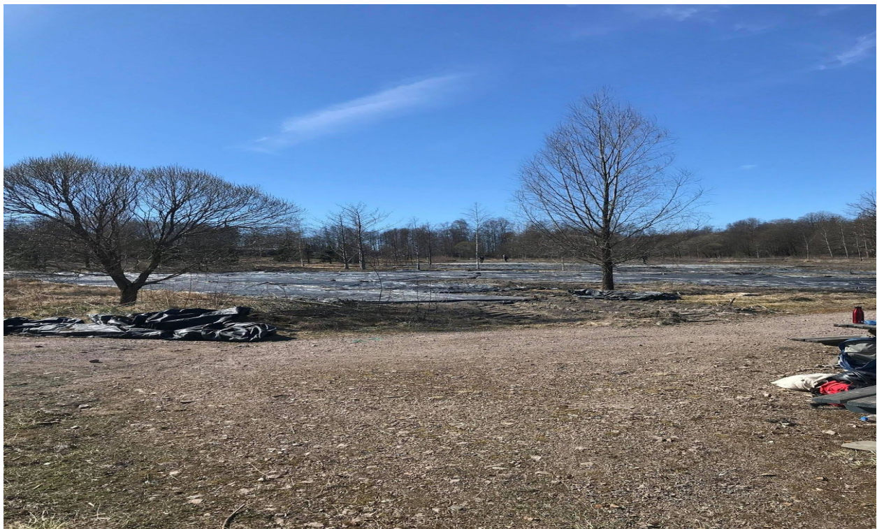
Bildene viser forberedelse til oppmåling, etter at Bymiljøetaten hadde arbeidet og pløyd området