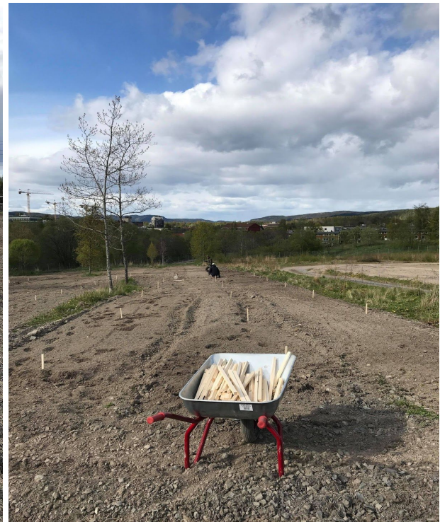
Bildene viser gjerdet som endelig kom på plass, og oppmåling av parseller. Her ble det lagt ned mange arbeidstimer.